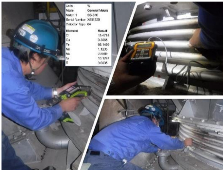
現地施工前の調査の様子