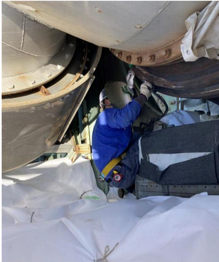
現地補修施工の様子